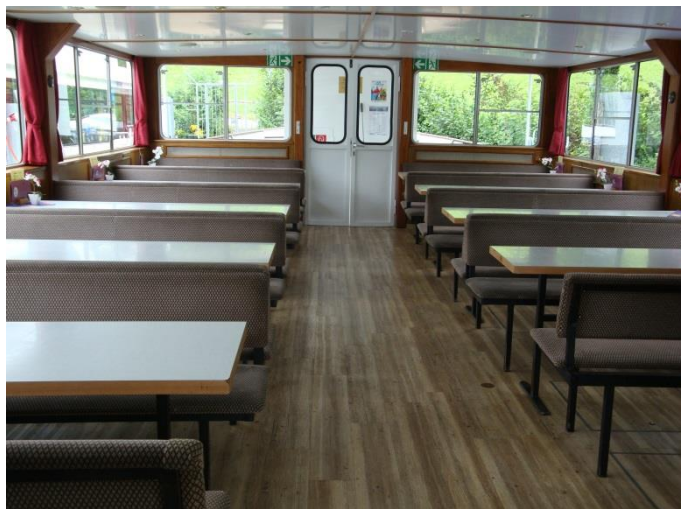
Salon Sicht Richtung Bug